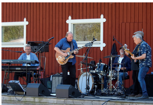
Bilder från jubileumsfesten. Och fler bilder kan ni se längre bak i tidningen.

Trygghet är ett viktigt ledord för oss och för våra hyresgäster. Genom våra trygghetsinventeringar