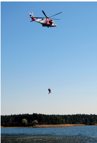
Sjöräddningen hade uppvisning med både båt och helikopter nere i hamnen.

Vädret var toppen. Och ni kom för att fira med oss. Det blev en riktigt rolig och lyckad jubileumsfest.