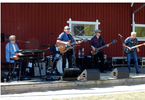
Mönsterås Bluesband bjöd på härligt gung vid två tillfällen under jubileumsfirandet.