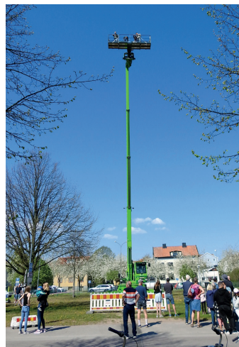
Kön ringlade sig lång för att få åka med Alvinssons teleskoplastare 24 meter upp i luften.

Så här med facit i hand hade vi inte behövt vara nervösa alls. Med bra planering, engagerad personal, drivna medaktörer, och härliga besökare, så kan det inte bli annat än bra. Tack för att ni kom och firade tillsammans med oss! ■