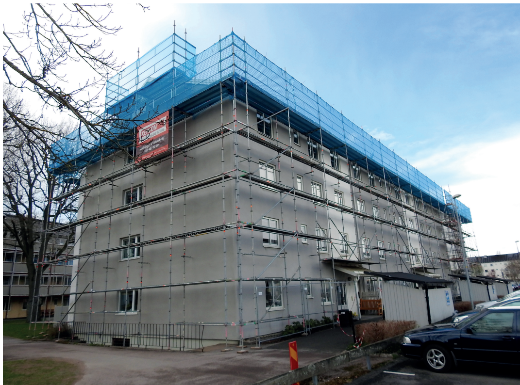
På Jacobs gränd 14 byter vi tak och installerar solceller.

H ar du e-faktura eller autogiro hos oss? Inga problem. Ansluter du dig till Kivra fortsätter det fungera precis som vanligt. Förutom om du har autogiro och är ansluten till Kivra. Då får du fakturor för förändrad hyra i Kivra istället för i din brevlåda. Bra va?