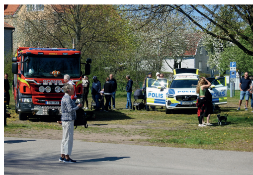
Räddningstjänst och polis fanns på plats och visade upp sina fordon.